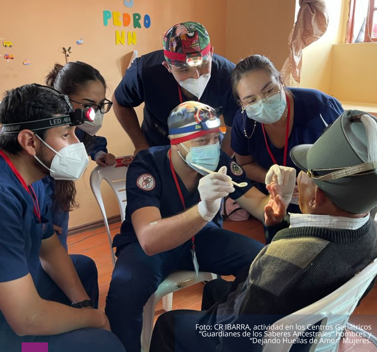
Foto: CR IBARRA, actividad en los Centros Geriátricos "Guardianes de los Saberes Ancestrales" hombres y "Dejando Huellas de Amor" Mujeres.

Gracias por su acción transformadora e inspiradora, este boletín es la muestra de la generosidad que mora en vuestros corazones, sigamos trabajando, sigamos cambiando vidas.