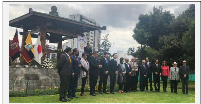
Evento: repique de la Campana de la Paz