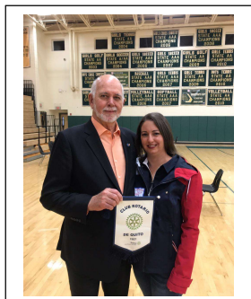
Cynthia Chediak con el Presidente de Rotary International Barry Rassin en Estados Unidos.