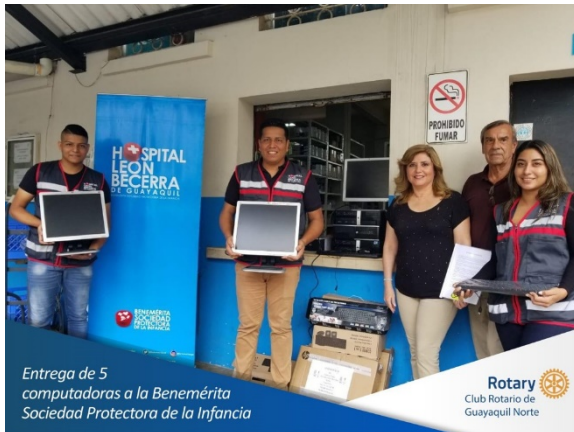
Entrega de 5 computadoras a la Benemérita Sociedad Protectora de la Infancia