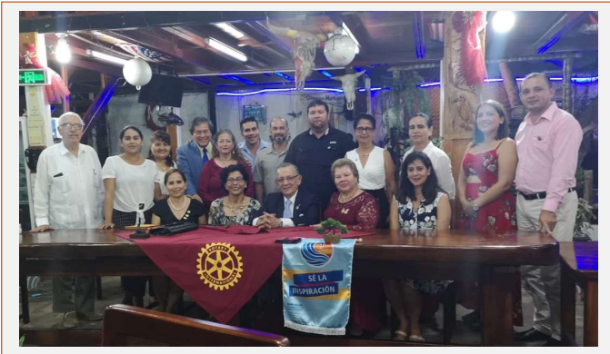
Visita al CR de Galápagos San Cristóbal