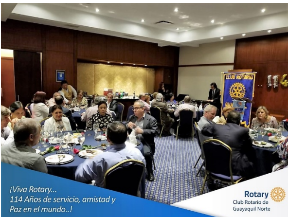
¡Viva Rotary... 114 Años de servicio, amistad y Paz en el mundo..!