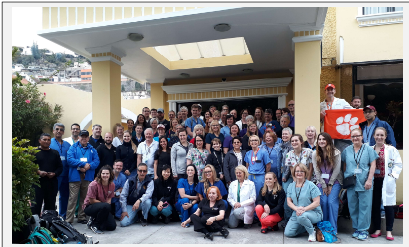
XXVII Jornadas Médicas – Club Rotario de Ambato