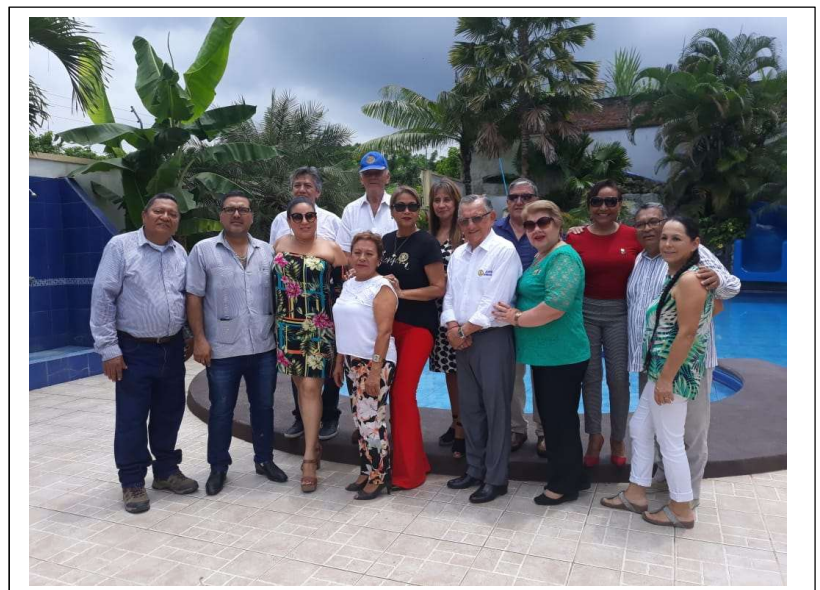
Visita Protocolaria Club Rotario de las Palmas Esmeraldas