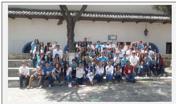
Evento: De Chiro a Millonario