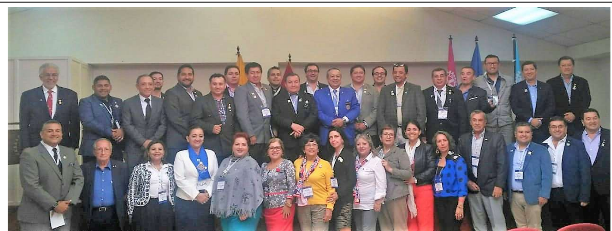
PETS Y ASAMBLEA DEL DISTRITO EN CUENCA