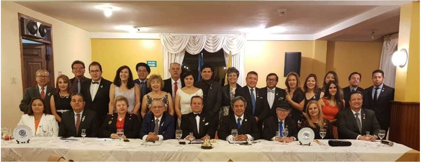
Constitución del Club Rotario de Rumiñahui