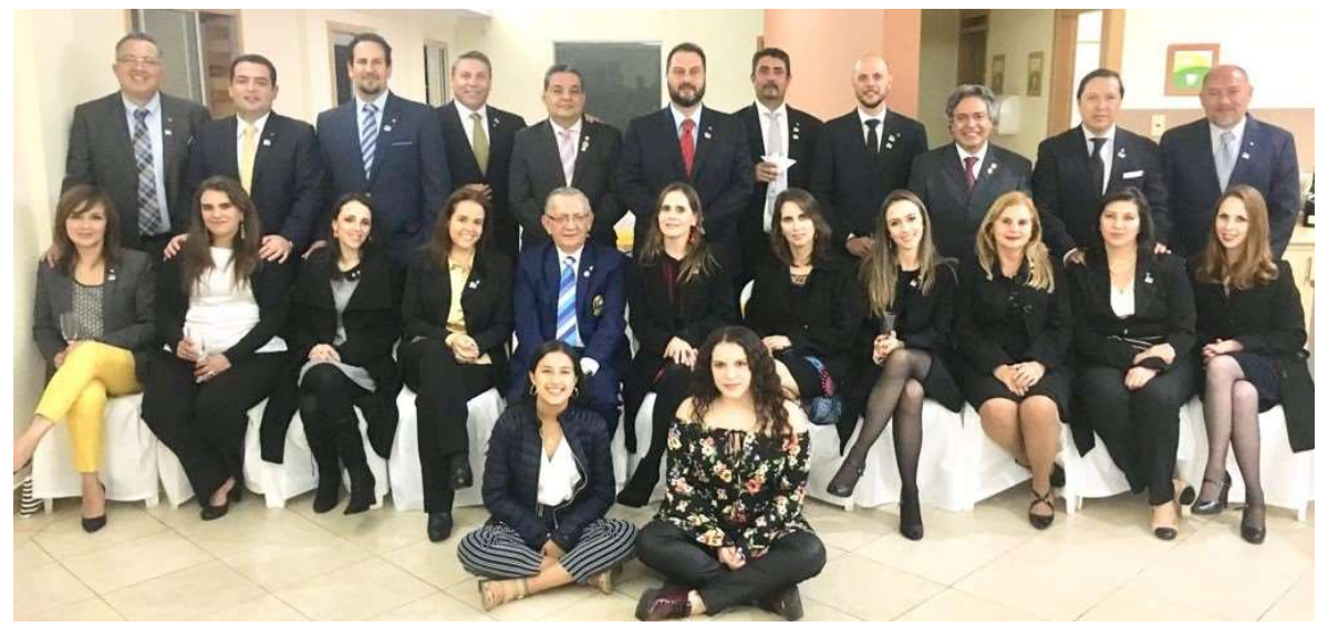
Constitución del Club Rotario de Cumbayá