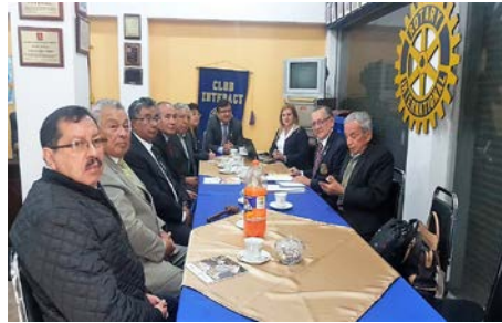
Visita protocolaria al CR de Tulcán