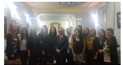
JF y Mariana con el Comité de Cónyuges del CR de Ibarra