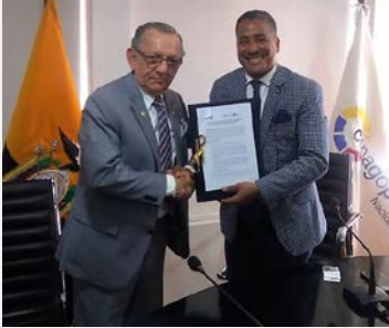
Convenio Interinstitucional D4400 y COGANOPARE