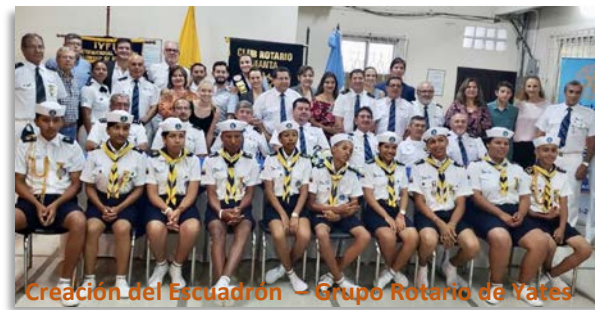
Creación del Escuadrón – Grupo Rotario de Yates