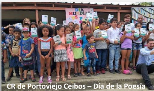
CR de Portoviejo Ceibos – Día de la Poesía