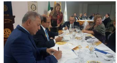
Covenio de Cooperación, Distritos de México, Colombia v Ecuador (Ibiales)