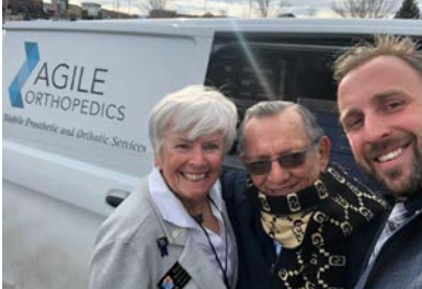
Visita del Gobernador a Denver, USA