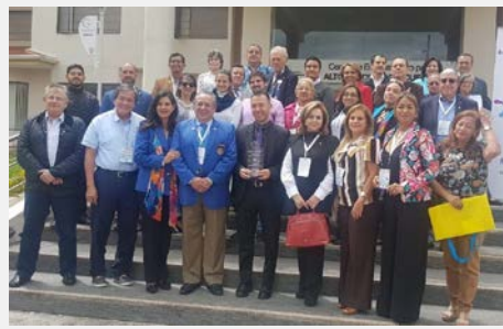
Capacitación a Capacitadores 2019-2020