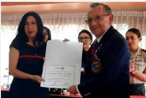
Entrega Carta Constitutiva al CR de Cumbayá (#68 en el D4400)