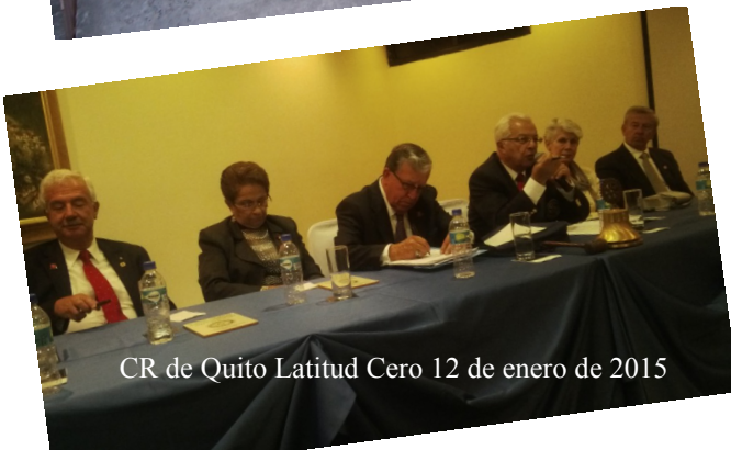
CR de Quito Latitud Cero 12 de enero de 2015