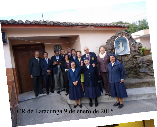
CR de Latacunga 9 de enero de 2015

Con estas cifras podemos decir que es un motivo de verdadero orgullo y alegría, en este cumpleaños de Rotary, contribuir al avance de nuestra querida institución, su Fundación y toda la humanidad beneficiada. No hay la menor duda; esta labor mejora nuestra imagen en estos 110 años y profundiza la imponente obra a nivel de comunidades alrededor del mundo.