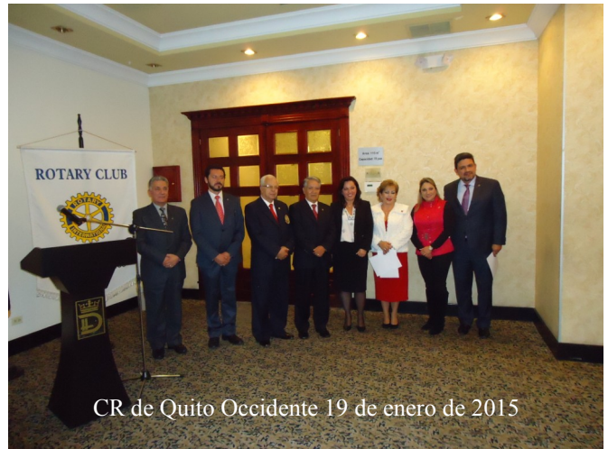
CR de Quito Occidente 19 de enero de 2015