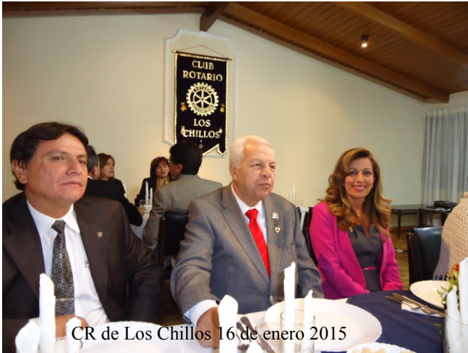
CR de Los Chillos 16 de enero 2015