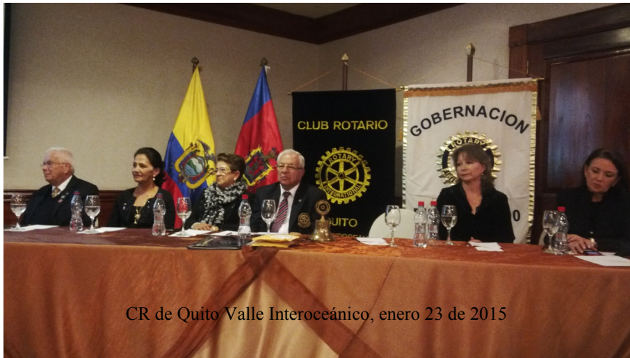
CR de Quito Valle Interocéánico, enero 23 de 2015