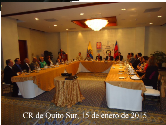
CR de Quito Sur, 15 de enero de 2015