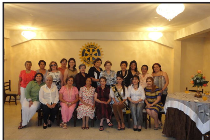
REUNION COMITE DE DAMAS PORTOVIEJO