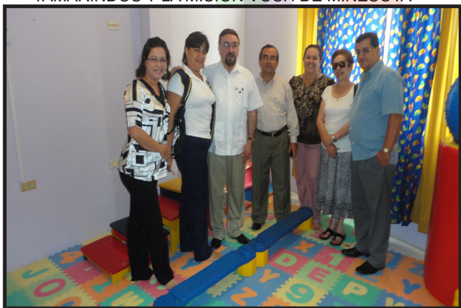
CENTRO DE ESTIMULACION C.R. CHONE