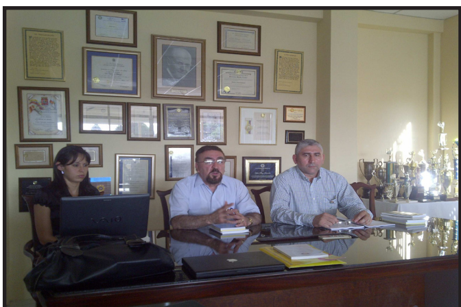
REUNION DE TRABAJO CR. PORTOVIEJO