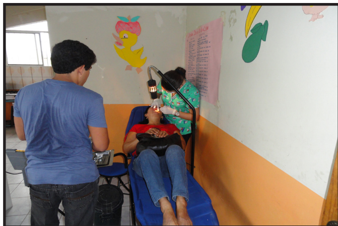
CAMPAÑA MEDICA PORTOVIEJO SAN GREGORIO