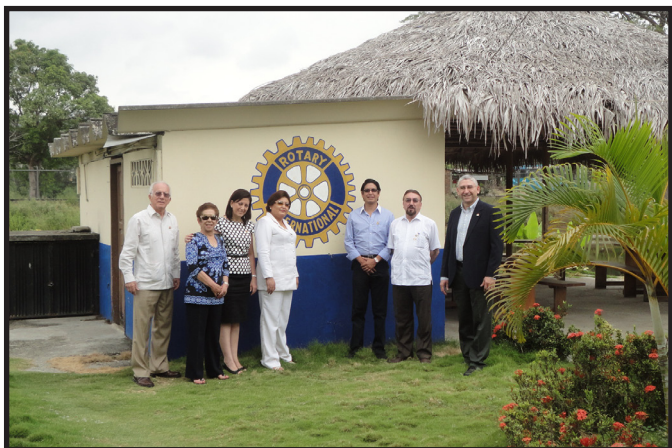
PARQUE FORESTAL PORTOVIEJO