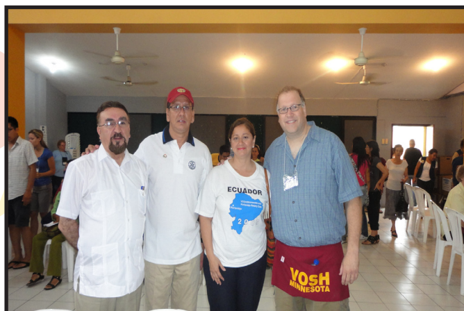
MISION VOSH Y C.R PORTOVIEJO REALES TAMARINDOS