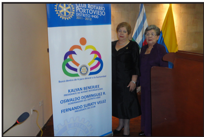
SOCIAS CR. PORTOVIEJO