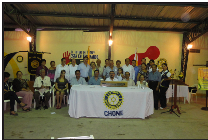
SOCIOS CLUB ROTARIO CHONE