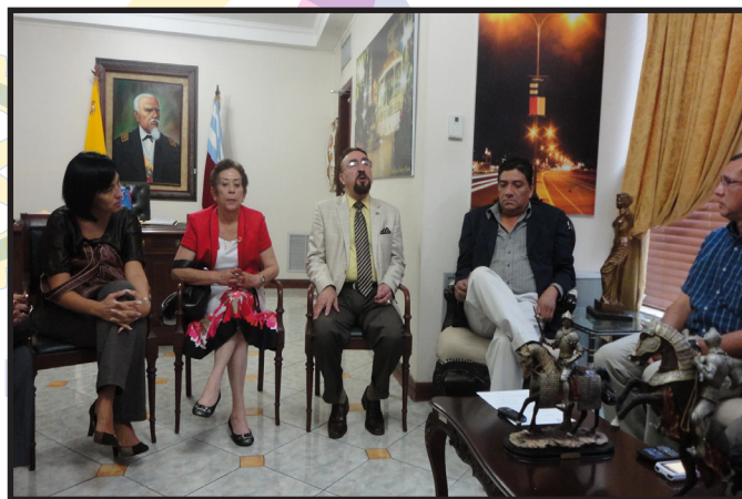
VISITANDO ALCALDÍA DE PROTOVIEJO