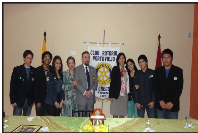
INTERCAMBISTAS DEL CR. PORTOVIEJO SAN GREGORIO