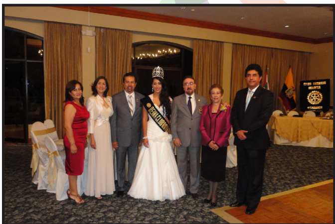
SESION SOLEMNE CR. MANTA