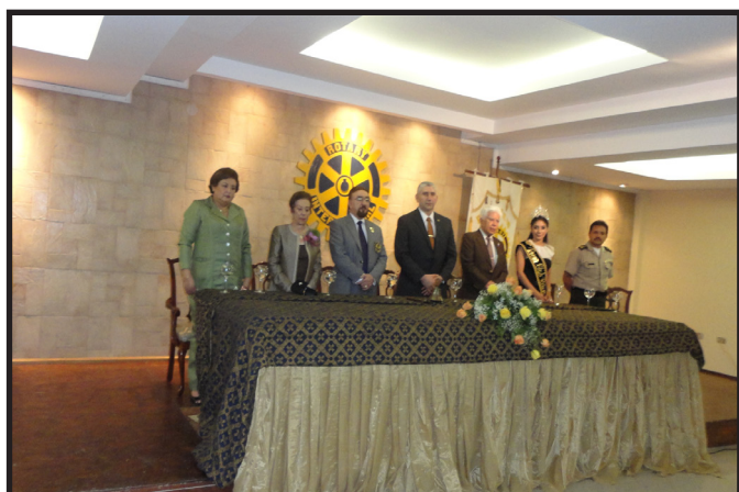
SESION SOLEMNE CR. POTOVIEJO