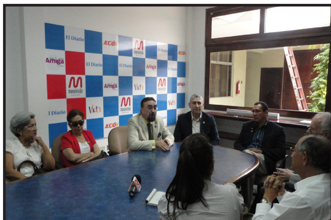
ENTREVISTA EN MANAVISION