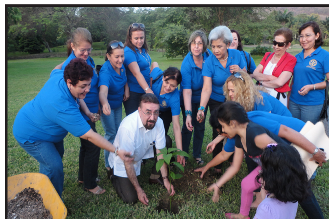
SIEMBRA DE UN ARBOL EN JARDIN BOTANICO U.TECNICA DE MANABI