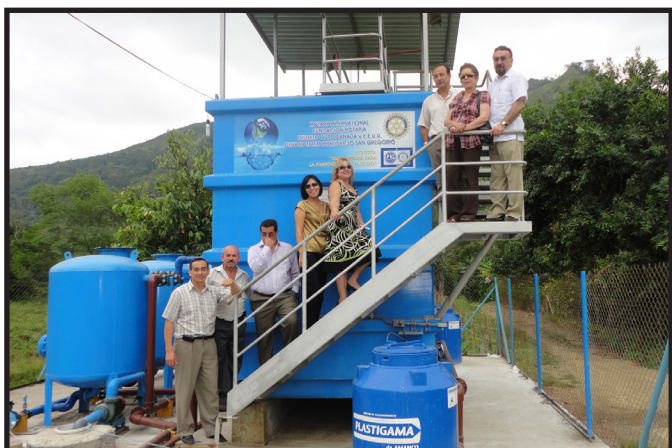
OBRA ENTREGADA POR CR. PORTOVIEJO SAN GREGORIO