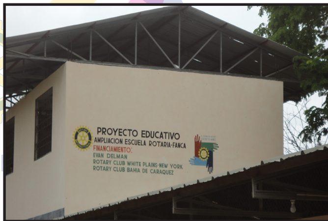
OBRA DEL CR. BAHIA DE CARAQUEZ