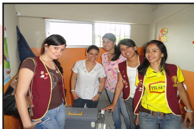
ROTARACT P. SAN GREGORIO