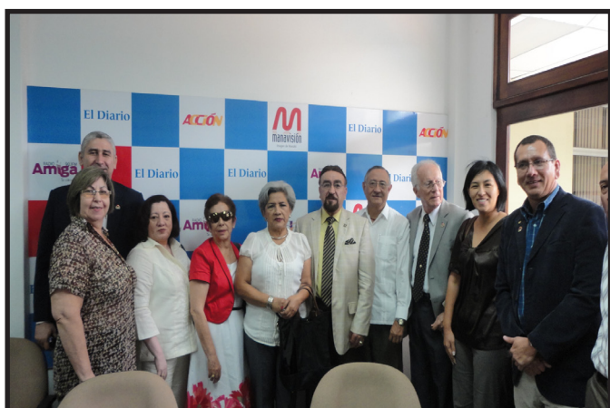
VISITA A EL DIARIO