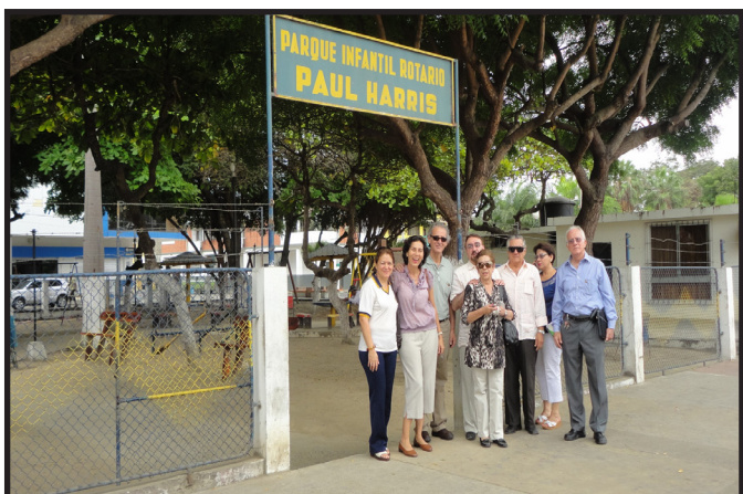
CLUB ROTARIO BAHIA DE CARAQUEZ