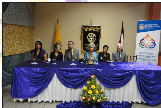
SESION SOLEMNE CR. PORT. SOLIDARIO