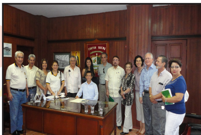
VISITA A LA ALCALDÍA DE BAHIA DE CARAQUEZ