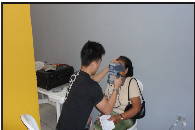
JORNADAS OFTALMOLÓGICAS CR. PORTOVIEJO REALES TAMARINDOS Y LA MISION VOSH DE MINESOTA