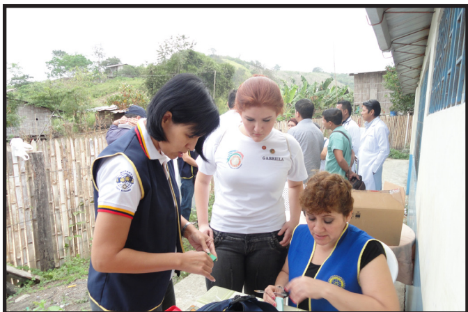
CAMPAÑA MEDICA PORTOVIEJO SAN GREGORIO