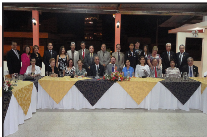
CLUB ROTARIO BAHIA DE CARAQUEZ