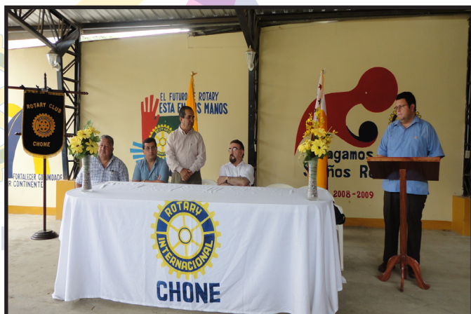
DIRECTIVA CLUB ROTARIO CHONE