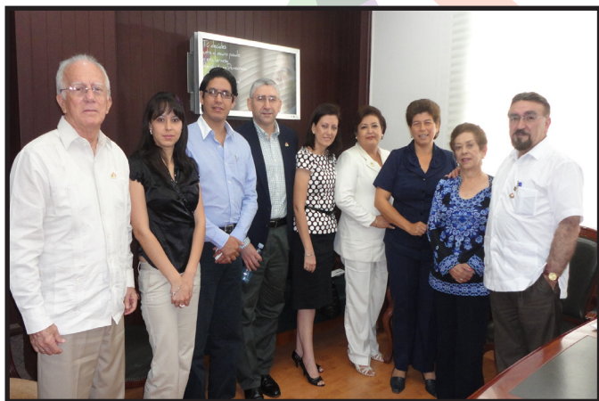
VISITA A LA GOBERNACION DE MANABÍ