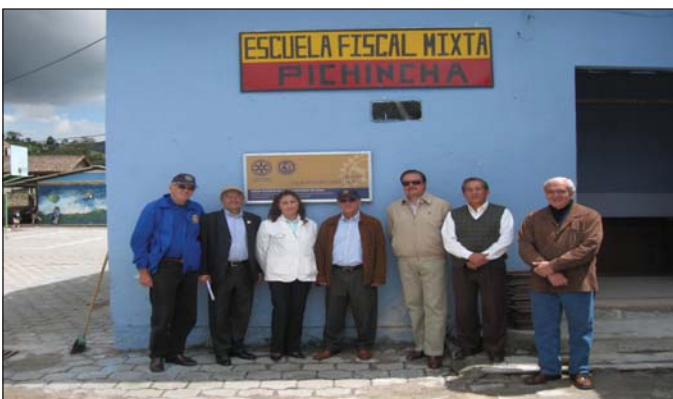
Visita proyecto de agua escuela Pichincha en Nono con CR Quito Norte