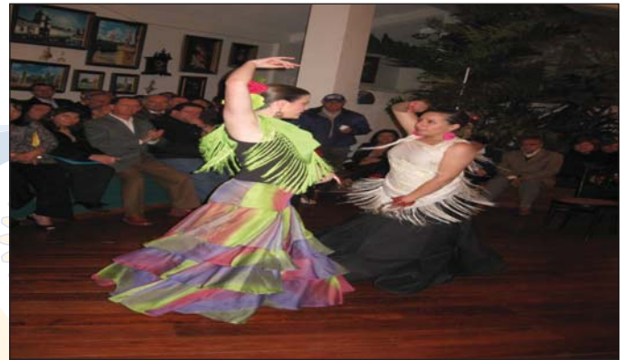
Bailadoras de flamenco en el coctel de companerismo en la feria de proyectos