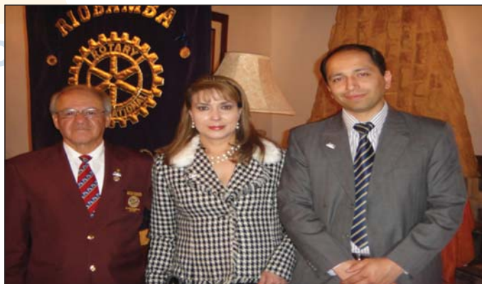
Ingreso nuevos socios CR Riobamba