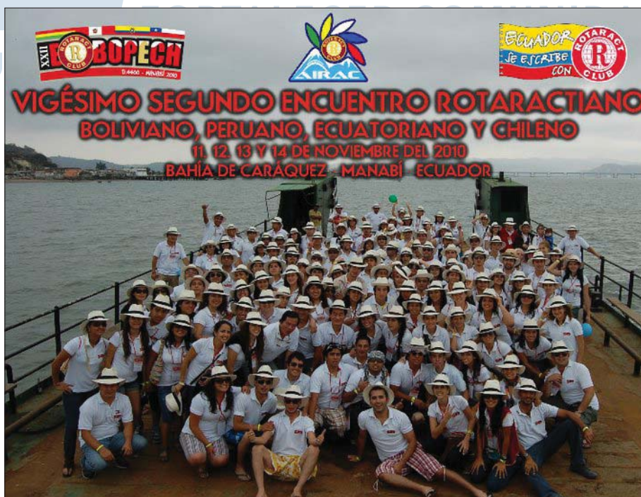
Foto oficial en la Gabarra de Bahía de Caráquez de los participantes.