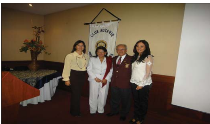
Ingreso nuevos socios CR Ambato Cosmopolita