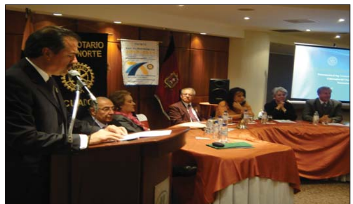
Sesión solemne CR Quito Norte