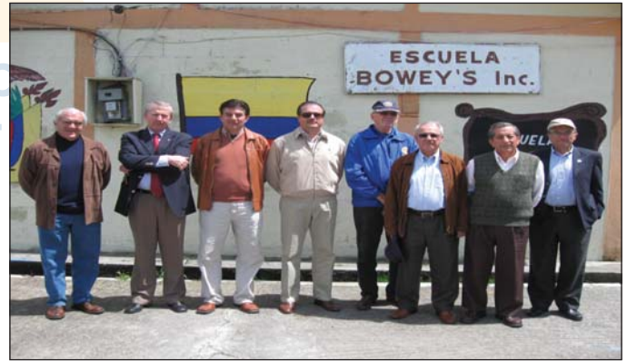
Visita a proyecto de agua con CR Quito Norte en Nono