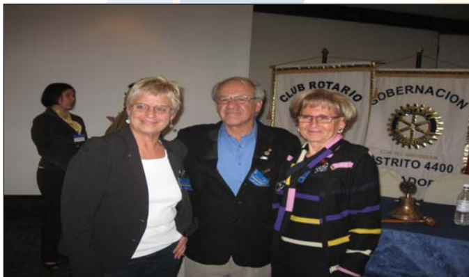
El Gobernador con las Rotarias francesas en la feria de proyectos