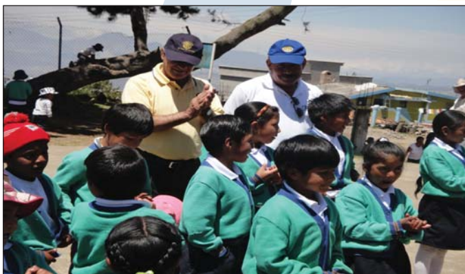
Programa de prevención de VIH-sida con CR Quito Occidente