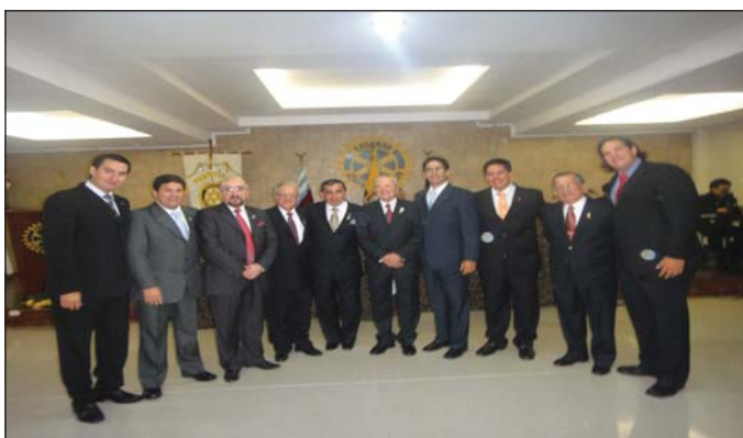
Directiva CR Portoviejo