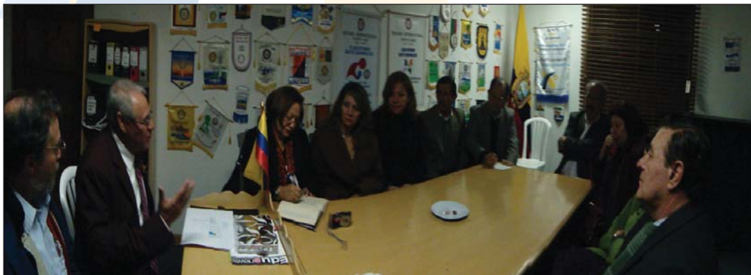
Sesión de trabajo Quito Equinoccio