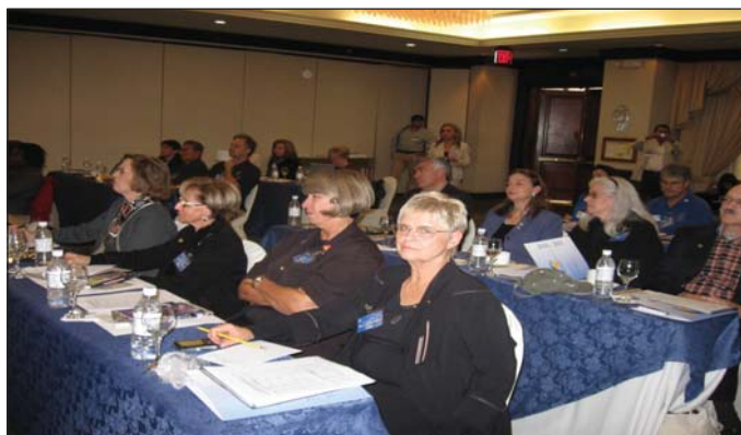
Participantes internacionales en la feria de proyectos