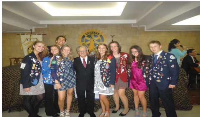
Chicos de intercambio YEP en Portoviejo