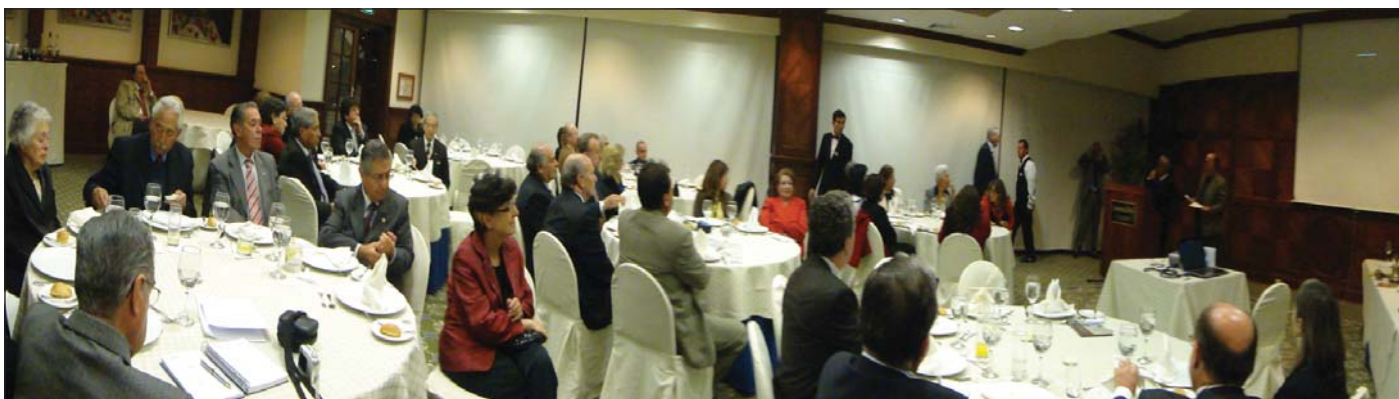
Visita del Gobernador a su Club Quito