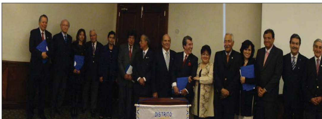
Ingreso de 4 nuevos socios CR Quito