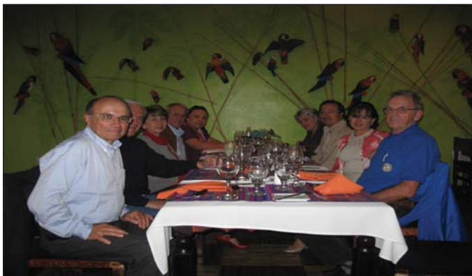
Sesión de trabajo con Junta Directiva CR Quito Valle interoceánico