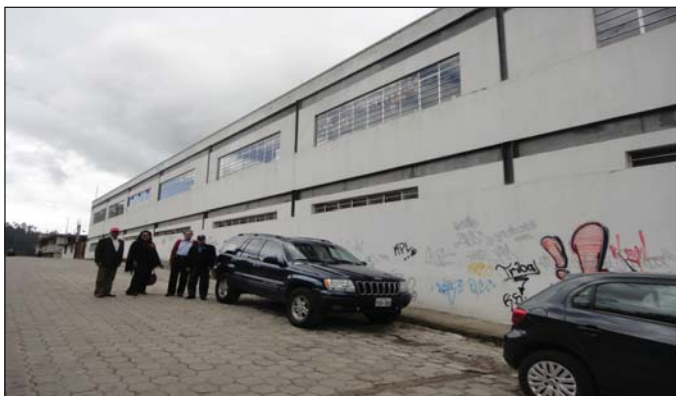
Escuela construida con canje de deuda con el Reino de España y CR Quito Equinoccio