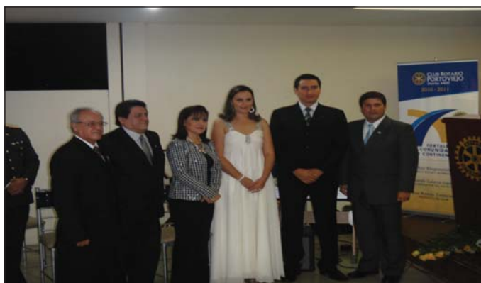
Ingreso nuevos socios CR Portoviejo