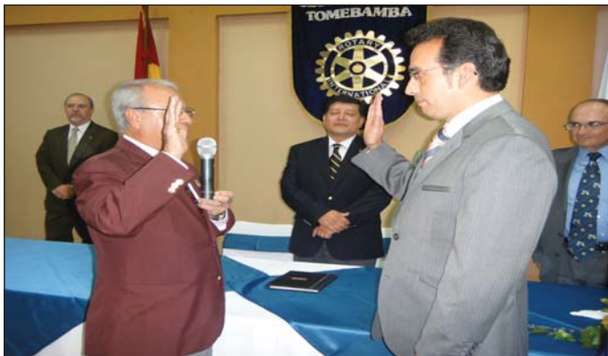
Ingreso nuevos socios CR Cuenca Tomebamba