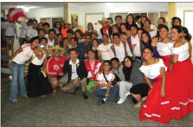
Noche de intercambio cultural y talentos.