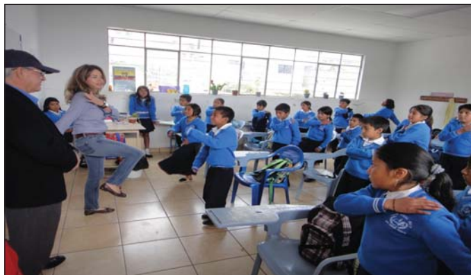
Clase práctica de gimnasia cerebral en la escuela Juan Carlos Peralta con CR Quito Equinoccio