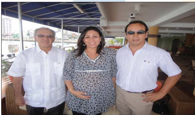
Ingreso nuevos socios CR Manta