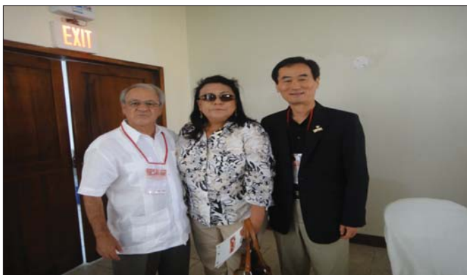
Delegado del Presidente de Rotary International al evento de ERBOPECH en Bahía de Caráquez