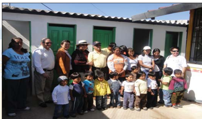
Inaguración de proyecto Agua Segura en Jardin Semillitas de Amor con CR Quito Occidente