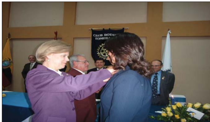
Ingreso nuevos socios CR Cuenca Tomebamba