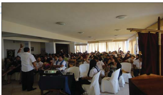
ERBOPECH en Bahía de Caráquez