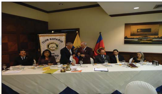
Gobernador recibiendo banderín del Club Quito