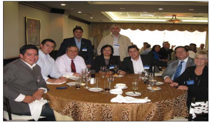
Almuerzo de amistad con los participantes en la feria de proyectos