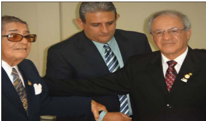
CR Portoviejo, entrega de reconocimientos Paul Harris