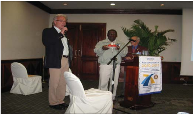
Miembro de la comunidad presenta muestra de productos en la feria de proyectos