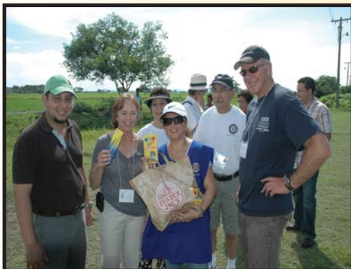
Visita Rotarios Los Angeles a los recintos Monte Alto y SanGil para proyecto de Agua Potable y Letrinas