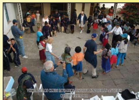
Visitantes bailando en El Quinche junto con niños de la comunidad de Cucupuro, beneficiarios de juegos infantiles en el proyecto del C.R. San Francisco de Quito