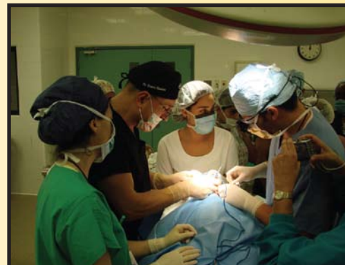
Operación de un niño con labio leporino