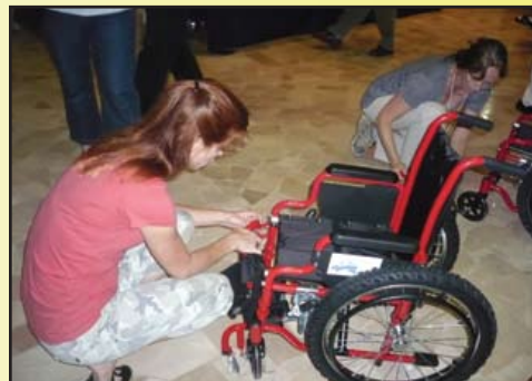
Rotarios del D-5280 ensamblando sillas de ruedas para entregarlas en el acto organizado por el R.C. La Puntilla en Guayaquil

La visita resultó un verdadero éxito y mereció las más efusivas felicitaciones de parte de los visitantes, calificándosela como la mejor que se ha hecho entre varios países, hasta el punto de que Manuel Nieto ha sido invitado a su Conferencia del Distrito en Palm Springs en Mayo, donde hará una exposición sobre este inolvidable evento, que es el programa estelar del Distrito 5280. Para Ecuador y el Distrito 4400 este programa le significa más de US$ 300.000 en proyectos, permitiéndole extender cada vez más su radio de acción social en beneficio de los más necesitados.