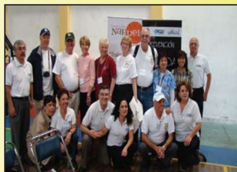
Socios del C.R. Quito Occidente y rotarios visitantes en el proyecto de prevención del SIDA