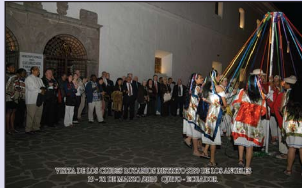
Presentación del Ballet Nacional Jacchigua a la entrada del Convento de San Francisco previo a la Cena de Celebración