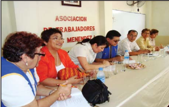
Reunión de trabajo con los visitantes sobre proyecto de donación de implementos dentales del C.R. Portoviejo Solidario