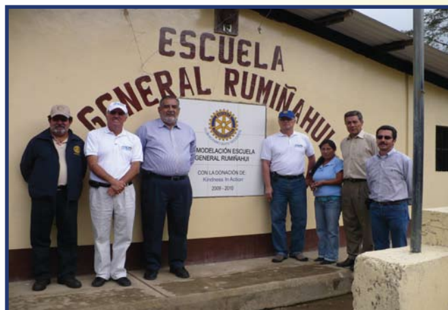
Visita a la Escuela General Rumiñahui en el Recinto Las Tolas en Tulipe