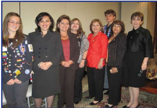
Visita del Gobernador al C.R. Quito Occidente