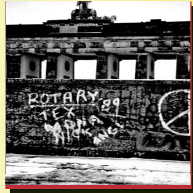
El entusiasmo por el papel desempeñado por Rotary en Alemania antes de su reunificación puede verse en el muro de Berlín antes de su desaparición en 1990.

Hoy en día existen 966 clubes y 48,781 rotarios en lo que fue Alemania Oriental. En Cuba lamentablemente no quedan ni existen hoy clubes rotarios, a pesar de haber sido el primer país de habla hispana en tener clubes rotarios en su jurisdicción; la libertad y la democracia son indispensables para que los clubes puedan coexistir, en ningún régimen comunista ha sido posible hacerlo. En China con muchos esfuerzos se está intentando promover la existencia de clubes rotarios.