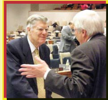
El presidente de RI John Kenny saluda a un rotario durante el día de Rotary en la ONU celebrado en Nueva York el 7 de noviembre.

Las palabras de Chávez inauguraron el día de Rotary en la ONU que tuvo lugar en la sede de las Naciones Unidas en Nueva York el 7 de noviembre. Más de 1.600 rotarios, funcionarios de la ONU y participantes en programas de Rotary para la juventud, asistieron a paneles de discusión sobre el agua, alfabetización, salud y asuntos relativos a la gente joven. Los vínculos de Rotary con la ONU datan de 1945, y Rotary cuenta con el rango consultivo más alto concedido a cualquier organización no gubernamental por el Consejo Económico y Social, organismo que supervisa las actividades de diversas agencias de las Naciones Unidas.