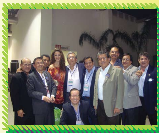
Socios del club luego del show.