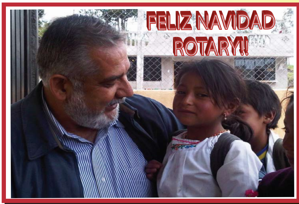
Gobernador con niña de la Escuela Illahuachico del Tungurahua