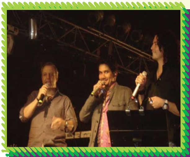
Los tres artistas cantando juntos.

El concierto se celebró en el Centro de Convenciones de Guayaquil el día jueves 22 de octubre de 2009, a las 20h00 y contó con la presencia de aproximadamente cuatro mil personas que no sólo disfrutaron al máximo del show sino que apreciaron publicidad e información de Rotary y al salir hicieron comentarios positivos sobre el nivel de organización que tuvo el evento, lo cual es muy positivo para nuestra querida Institución.