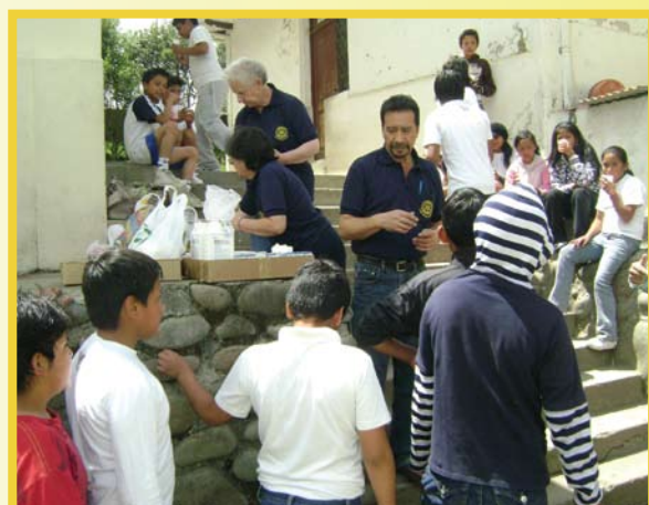
El Club Rotario Cuenca realizó una campaña de desparasitación en algunas escuelas de los sectores rurales y en albergues de la ciudad.