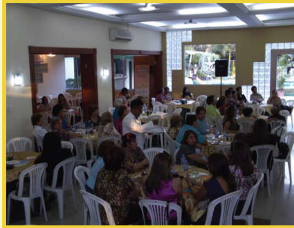
Comité de Damas del Club Guayaquil Urdesa organizó una tarde de Damas