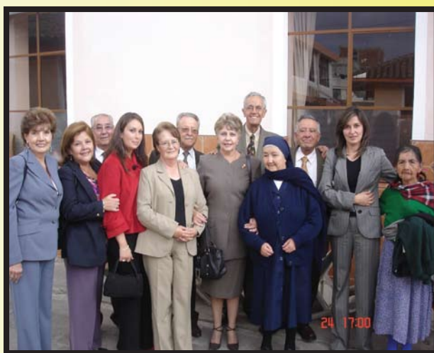
Miembros CR Latacunga