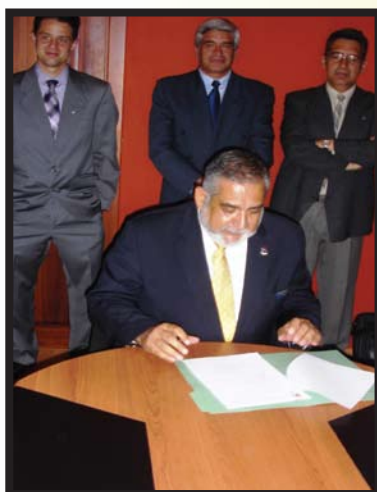
Testigo de Honor en firma del Convenio entre Municipio de Salcedo y CR Latacunga, equipamiento 5 guarderías