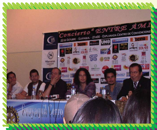
Rueda de prensa, interviene el Presidente del club.