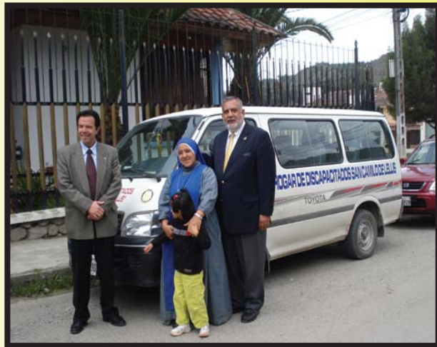
Con algunos niños del Hogar de Discapacitados San Camilo.