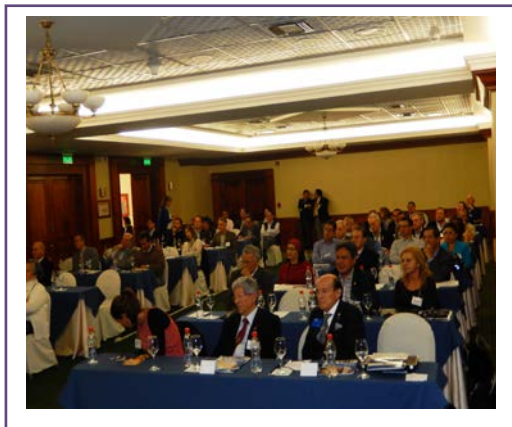
Asistentes al Seminario Conjunto en Quito