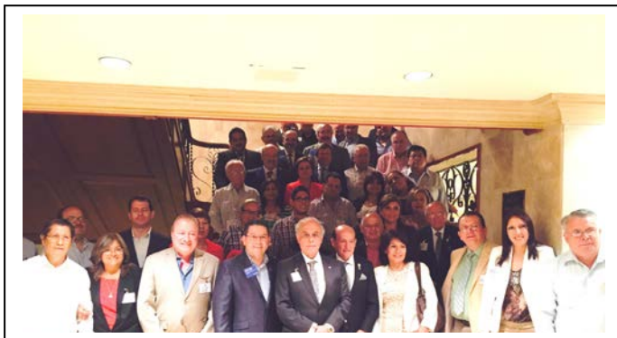
Asistentes al Seminario Conjunto en Guayaquil