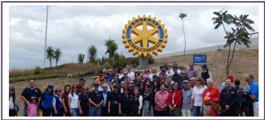
Grupo de compañeros de los clubes rotarios de Quito y de los Valles junto a la monumental Rueda Rotaria