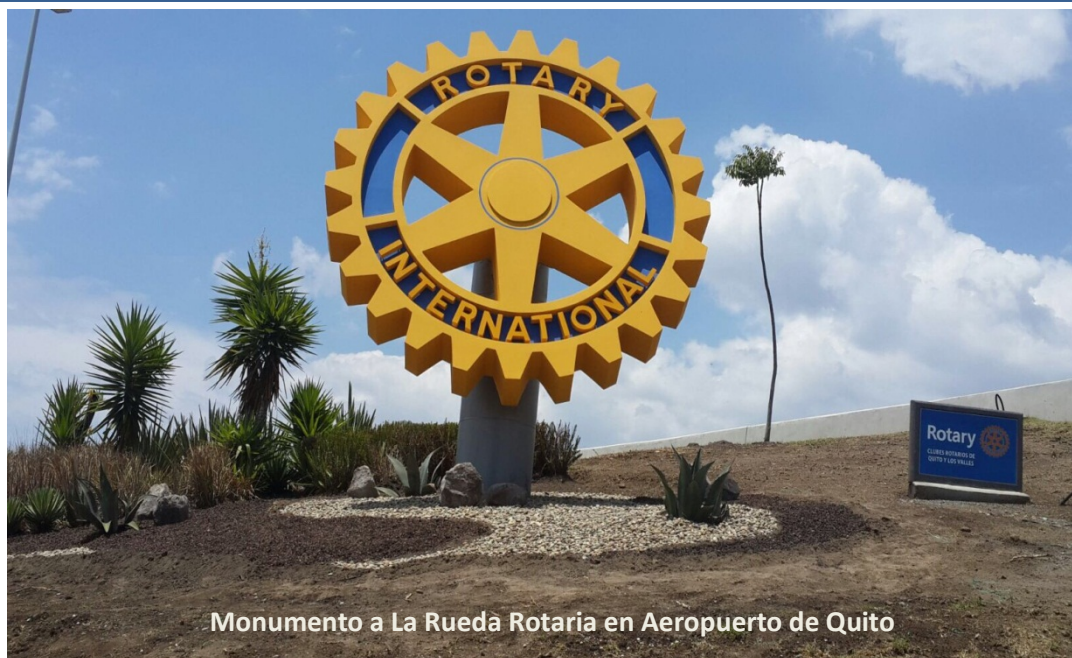
Monumento a La Rueda Rotaria en Aeropuerto de Quito