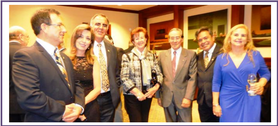
Grupo de compañeros del CR de Los Chillos y Los Chillos Milenio durante el coctel de inauguración