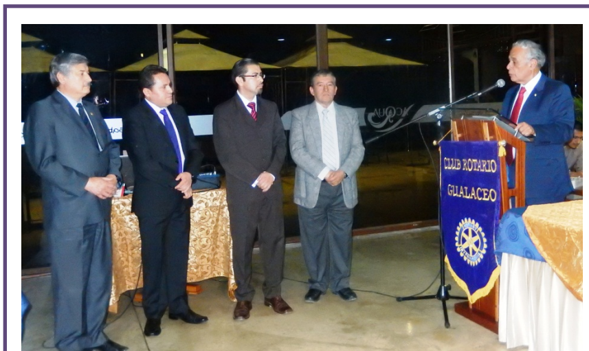
Incorporación de Nuevos Socios