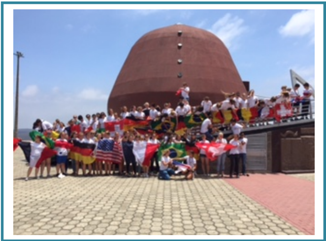
Paseo a Manabí de los estudiantes del programa de intercambio YEP organizado por el Comité Distrital y el CR de Portoviejo – San Gregorio